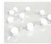
ew Flex SLX